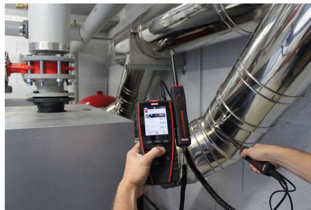
Feuchte und Luftmengen