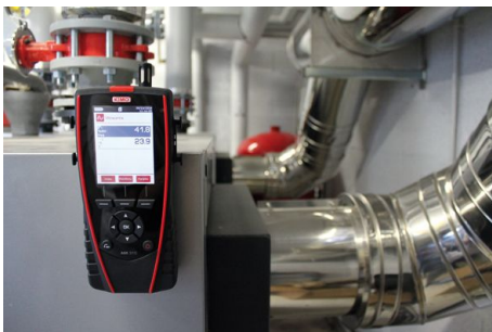
Umgebungs-klima (°C / %rF und Luftdruck)

AMI 310 PRF : Messgerät mit ±500 Pa Differenzdruck-Modul, 300 mm Prantl-Staurohr Ø6 mm , 2 x 1 m Silikonschlauch, Edelstahlrohr, schnurloser Edelstahl Feuchte-/Temperatursonde, Hitzdrahtsonde mit Teleskop, und schnurlosem Ø100 mm Flügelrad