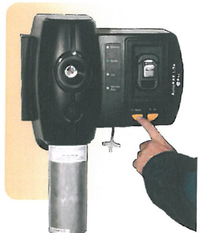
Funktionstest des ToxiRAE 3 mit der Funktionstest- und Kalibrierstation des AutoRAE Lite